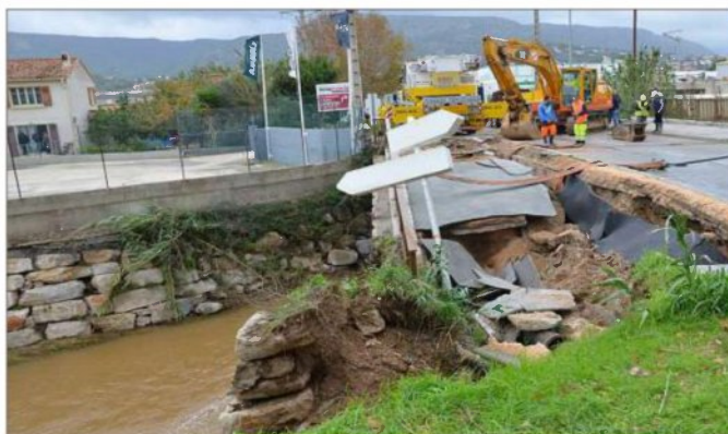
Fin novembre 2014, une partie du pont du Batailler avait été emportée dans une crue. C'est tout l'ouvrage qui va être reconstruit, élargi et rehaussé.

Au printemps 2016, des travaux de dévoisement des réseaux avaient constitué la première étape du chantier. Voici venu le temps du gros œuvre, la construction d'un pont d'une largeur de 16 m (au lieu de 8,50 m, largement sous-dimensionné) et dont le tablier sera rehaussé de