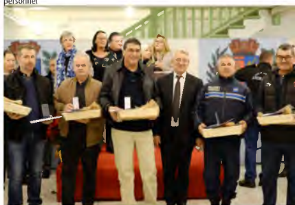
Remise des médailles du travail lors de la soirée de présentation des vœux au personnel