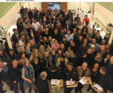
L'ensemble du personnel communal réuni pour fêter la nouvelle année