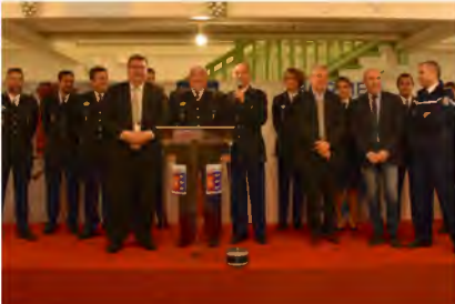
Vœux de la gendarmerie de la brigade Bormes - Le Lavandou