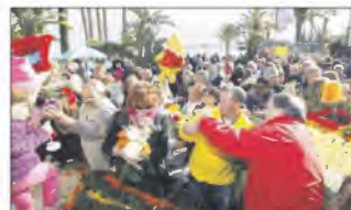
Fin du corso, bataille de fleurs : chacun a pu repartir avec son bouquet printanier.

Signalons encore le prix de la ville jumelée de Kronberg remis au char de la brigade locale de gendarmerie (le masque de Rio) et le prix du comité de jumelage, attribué aux associations DPLB et TLB pour « Rio, cité merveilleuse ».