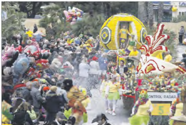
Pas de contrôle radar, mais un « masque de Rio » pour le char de la brigade locale de gendarmerie, suivi du char Brazil Campéao du SOL Football.