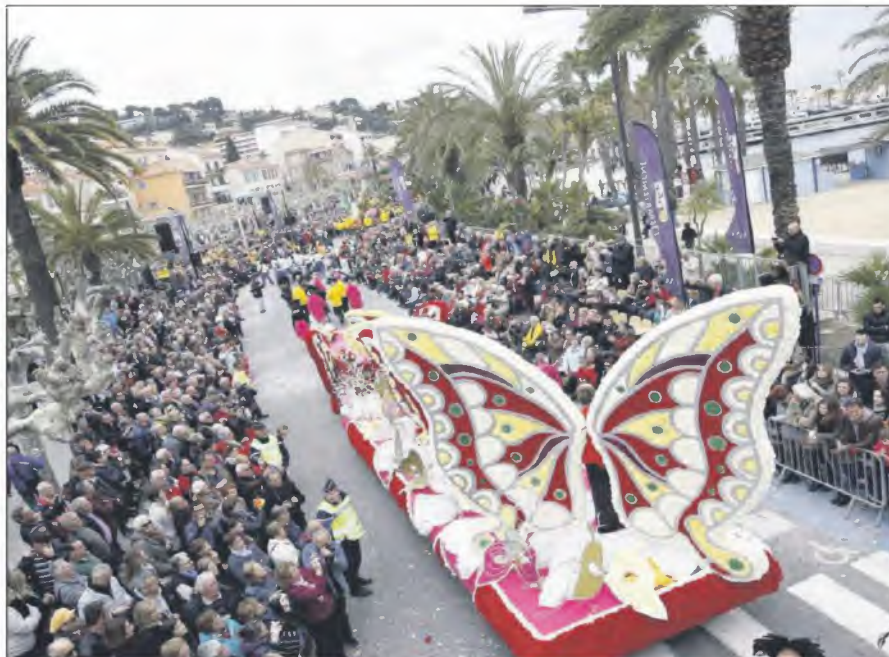
Hors concours, le magnifique char de la Reine, réalisé par les Amis de la Gare d'Hyères, a clos le premier passage sur le front de mer où des milliers de spectateurs avaient pris place.