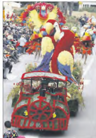
« Symbole de l'amitié, le couple d'aras », le grand char présenté par le comité de jumelage, a reçu le premier prix de sa catégorie, ainsi que le prix du public.