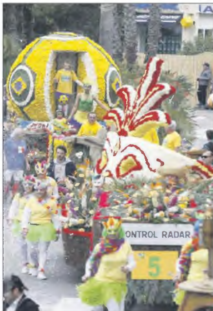
Pas de contrôle radar, mais un « masque de Rio » pour le char de la brigade locale de gendarmerie, suivi du char Brazil Campéao du SOL Football.