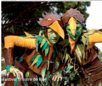
Festival Théâtre de Rue