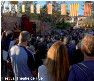
Festival Théâtre de Rue