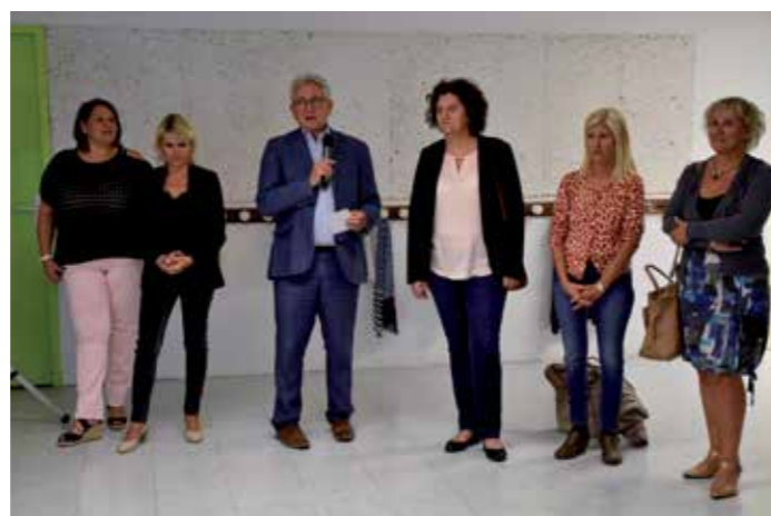
Inauguration de la crèche