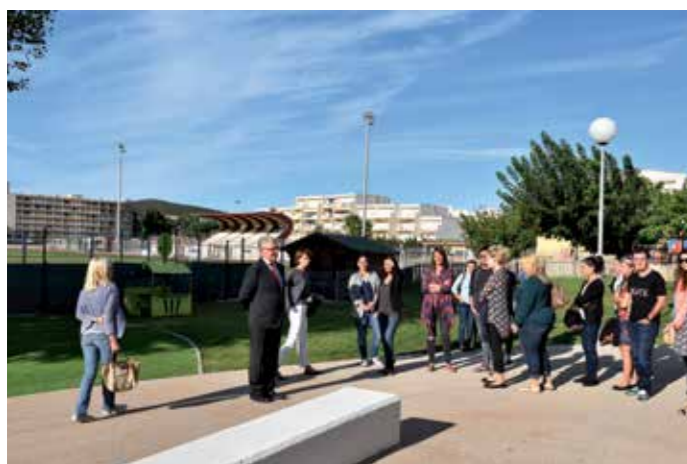
Visite de l'école maternelle

pose d'un sol souple amortissant les nuisances sonores. Dans ce nouveau cadre adapté à tous, chacun a su trouver sa place dès la rentrée, et les parents présents lors de la visite ont exprimé leur pleine satisfaction quant au travail effectué.