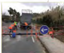
Travaux préparatoires à la réalisation du nouveau pont de franchissement du Batallier. Dévoisement des réseaux et éclairage public (1 re d'infos page 8)