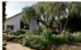
Aménagement du jardin de la Villa Théo.