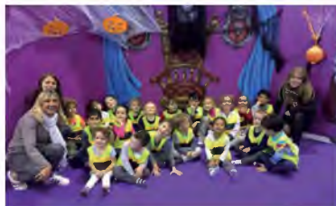
Les enfants inscrits au centre de loisirs pendant les vacances scolaires ont profité d'un dense programme d'activités