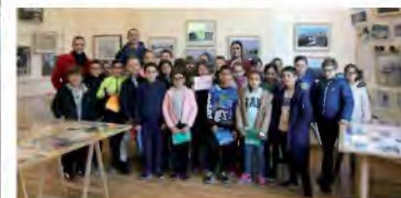
De nombreux écoliers visitent l'exposition sur l'architecture