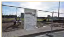
1 re phase de construction du nouveau pôle de danse et de musique. Terrassement et réalisation de la dalle béton.