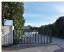
1 re phase de démolition de l'ancien bâtiment EDF. Le décaissage est terminé, la démolition interviendra avant la fin de l'année.