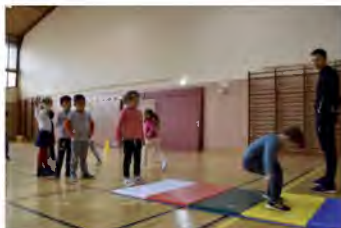
Toute l'année, l'EIS initie les petits Lavandourais aux sports individuels et collectifs