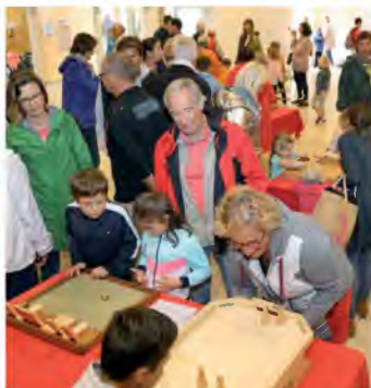
Malgré la pluie qui a conduit à l'annulation de plusieurs compagnies, le 8 ème festival de théâtre de rue a ravi des centaines de personnes