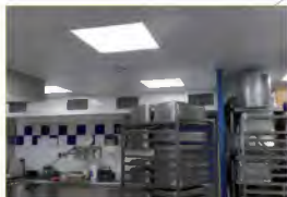
Réfection des faux plafonds et de l'éclairage dans le restaurant communal.