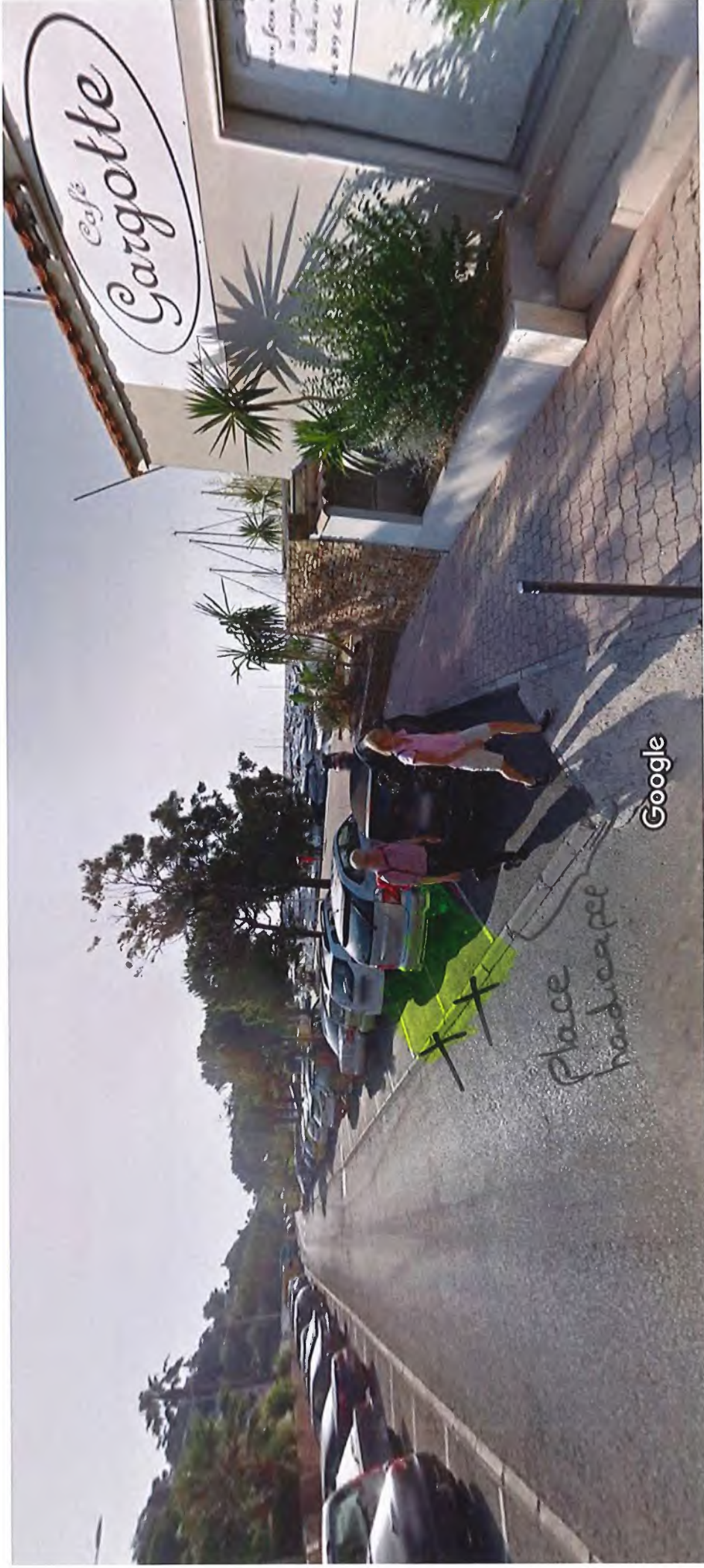
Date de l'image : juil. 2015