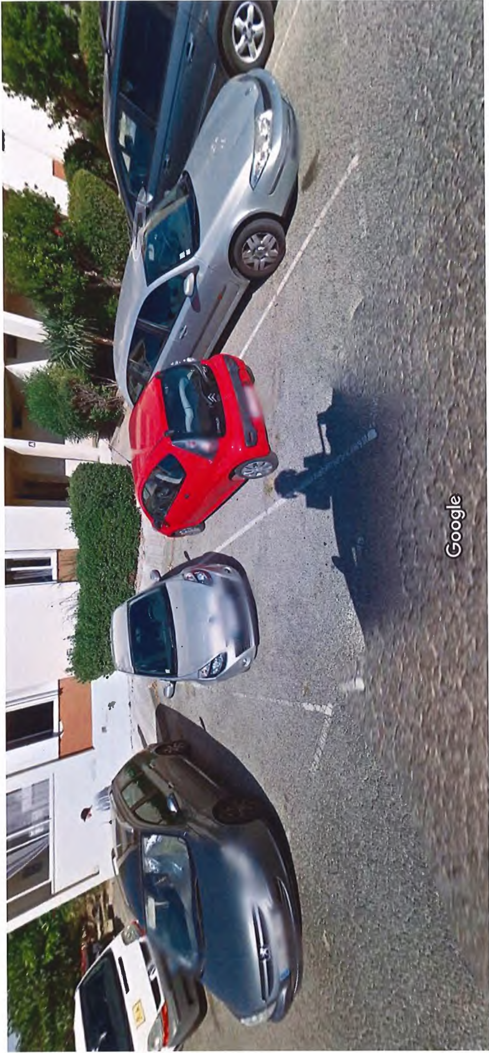
Date de l'image : sept. 2014