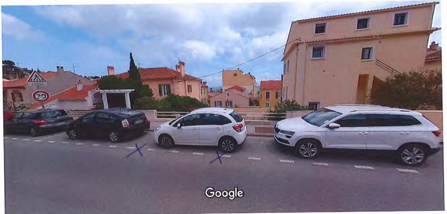
Date de l'image : juin 2020 Images may be subject to copyright.