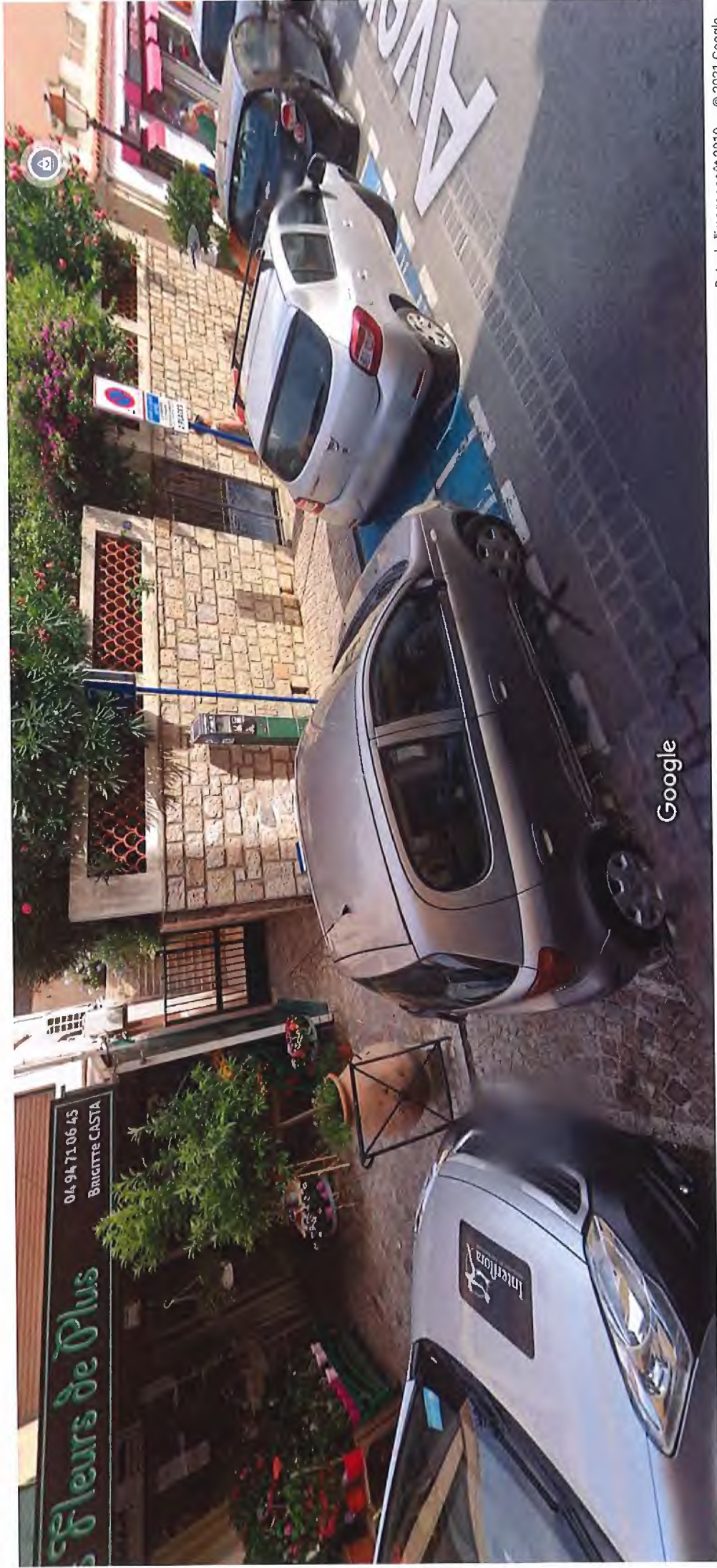
Date de l'image : août 2019