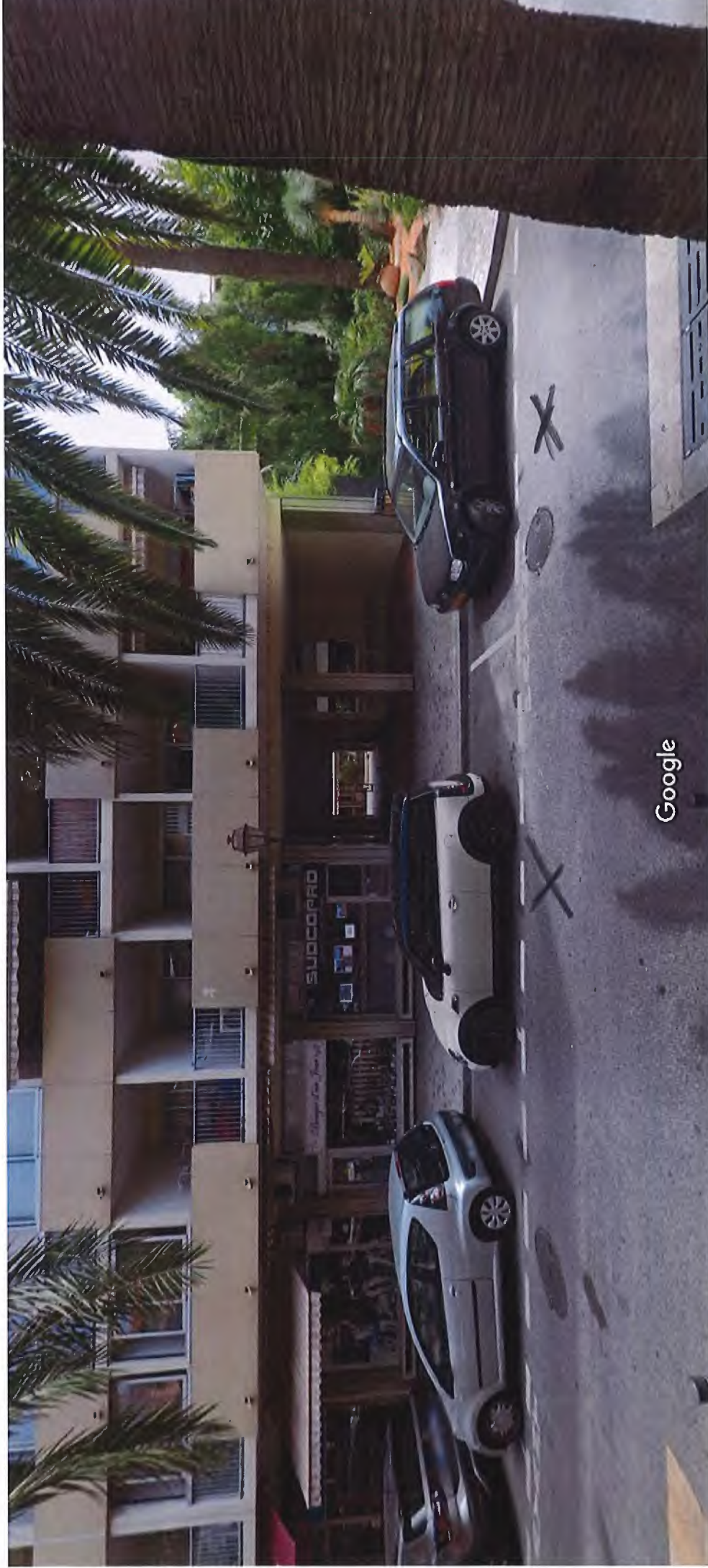
Date de l'image : août 2019