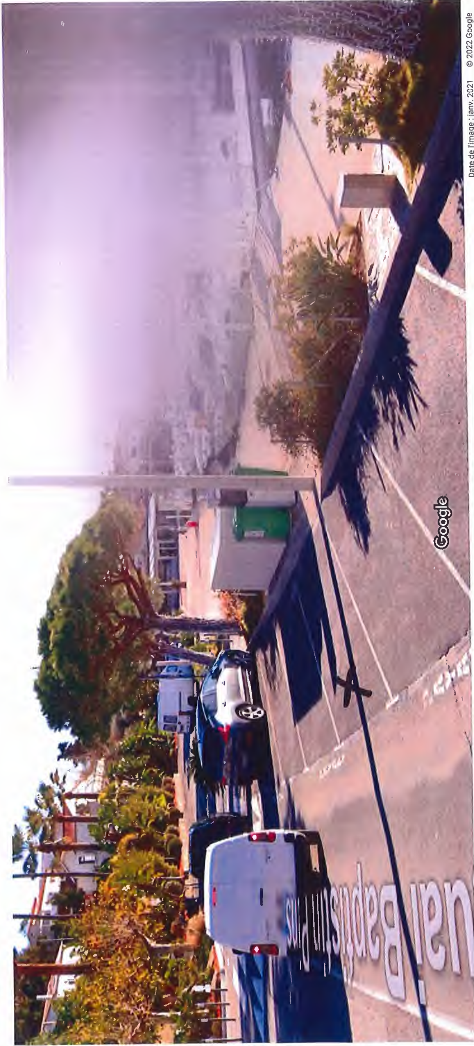
Date de l'image : janv. 2021