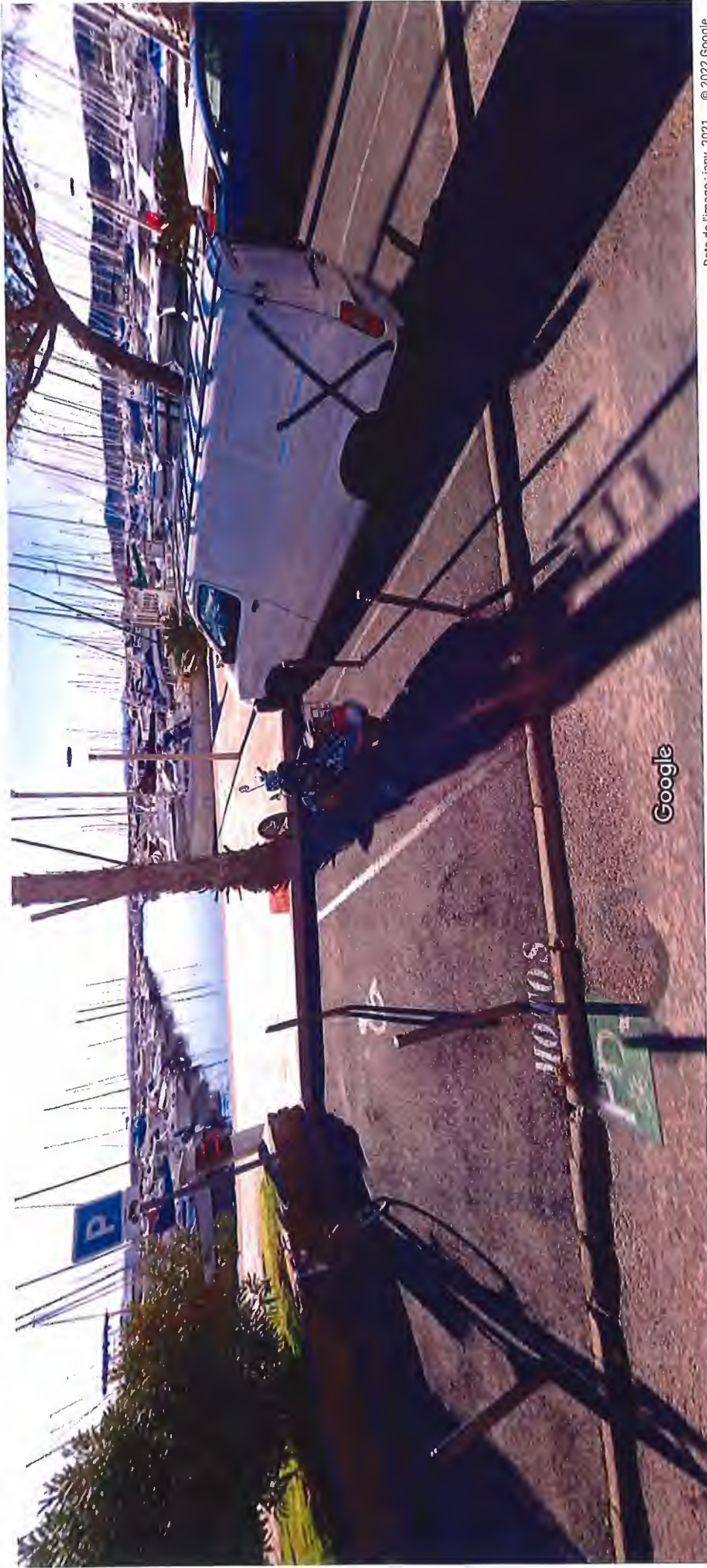
Date de l'image : janv. 2021