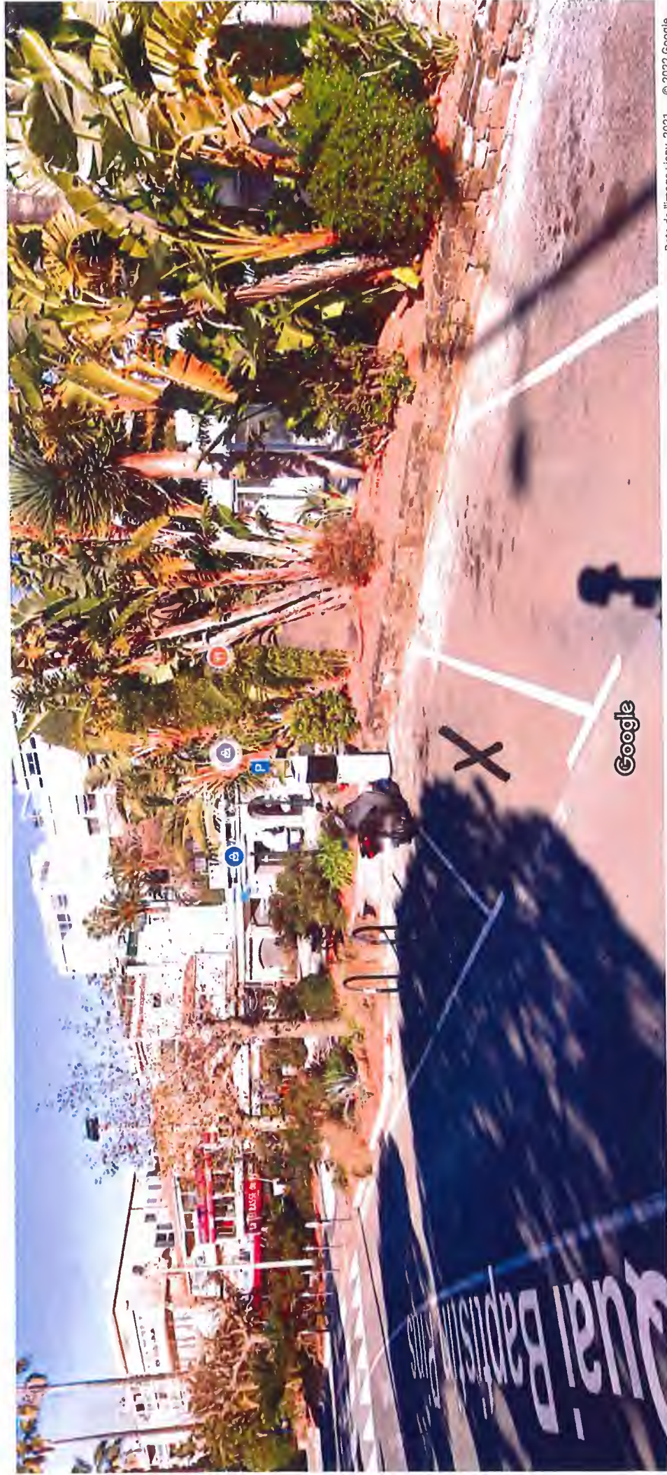
Date de l'image : janv. 2021